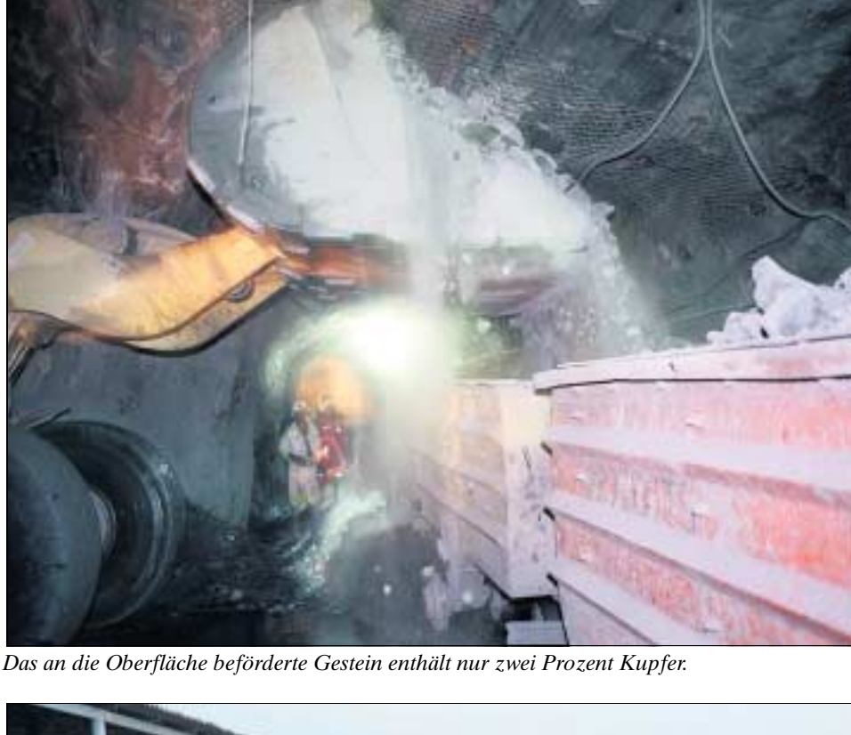
Das an die Oberfläche beförderte Gestein enthält nur zwei Prozent Kupfer.