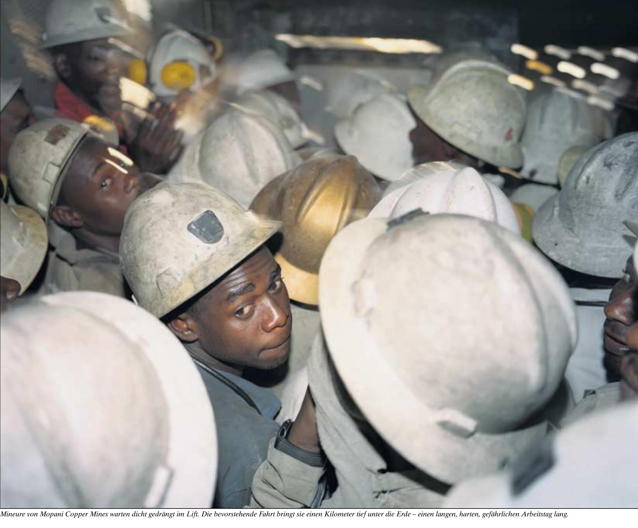
Mineure von Mopani Copper Mines warten dicht gedrängt im Lift. Die bevorstehende Fahrt bringt sie einen Kilometer tief unter die Erde – einen langen, harten, gefährlichen Arbeitstag lang.