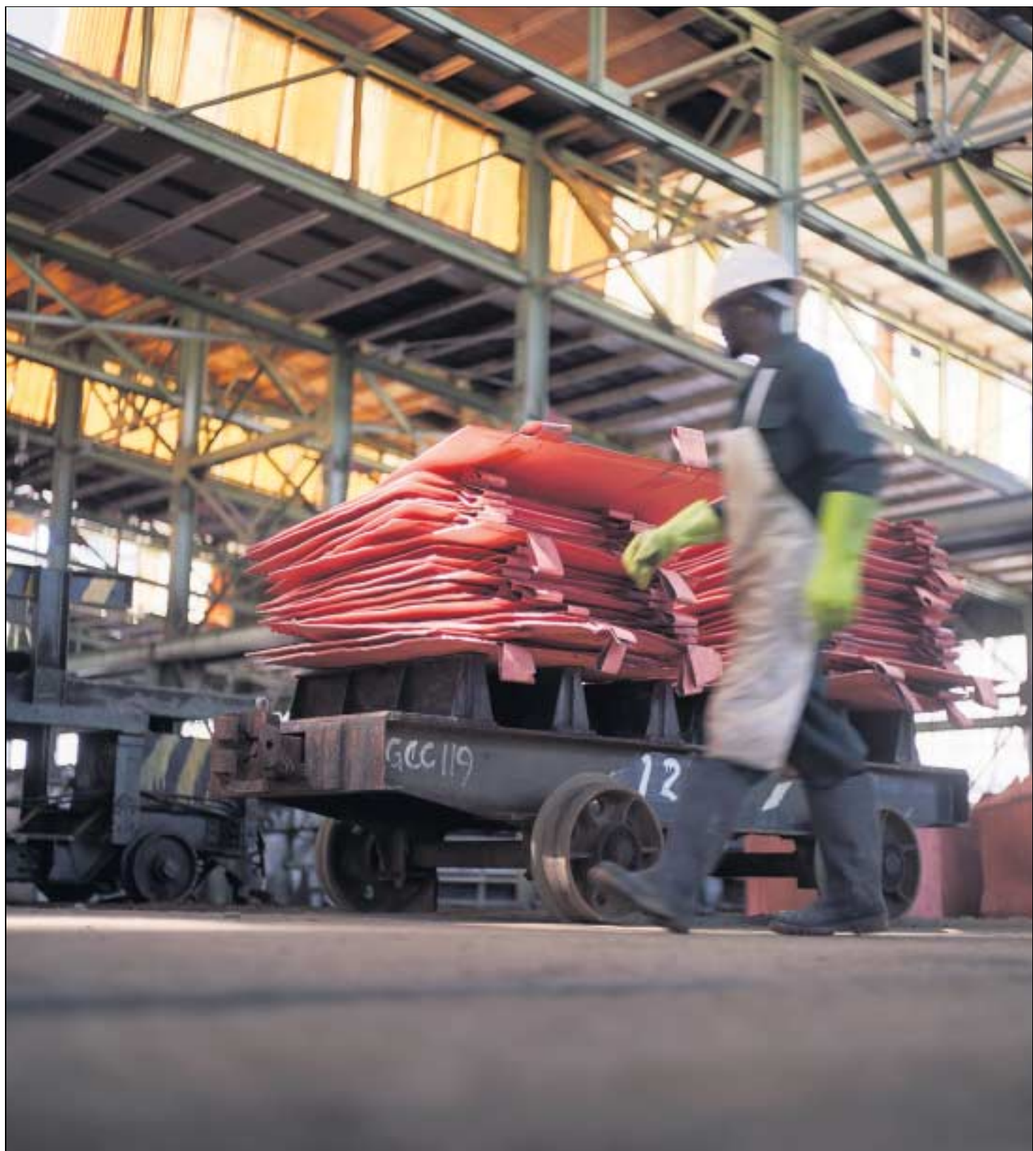
Reines Kupfer, welches von Sambia zu den Häfen Tansanias und Südafrikas gelangt – und von dort auf die Weltmärkte.