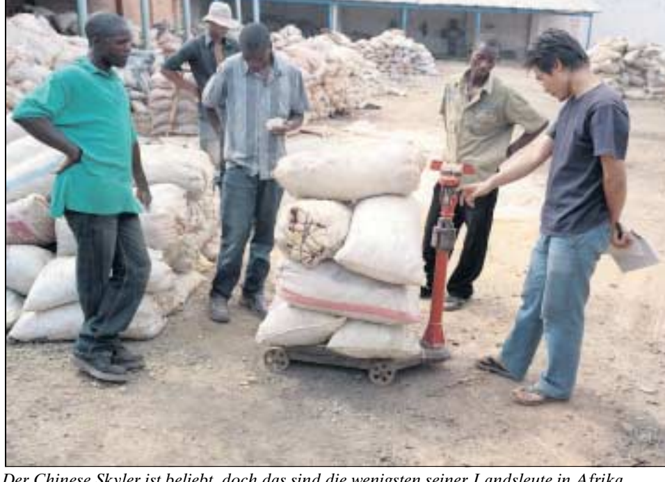
Der Chinese Skyler ist beliebt, doch das sind die wenigsten seiner Landsleute in Afrika.