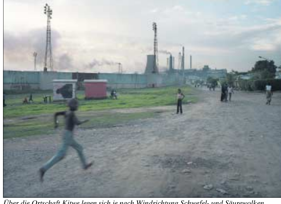
Über die Ortschaft Kitwe legen sich je nach Windrichtung Schwefel- und Säurewolken.